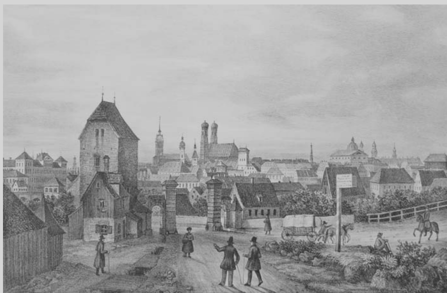
Blick vom Gasteig in westlicher Richtung über die Isar auf München um 1820