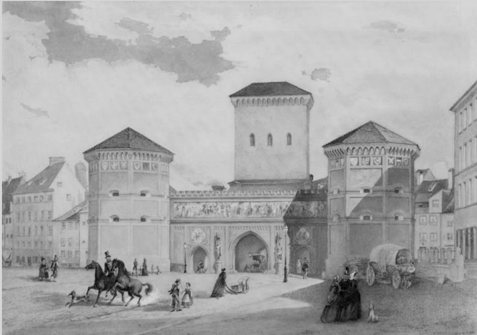
Das Isartor, Johann Georg Riegel, 1857