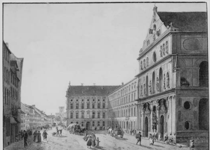
Die St. Michaelskirche und das Jesuitenkolleg, Heinrich Adam, 1829